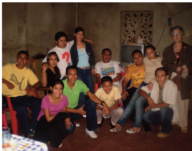
Cuantía subvencionada: 5.750 €