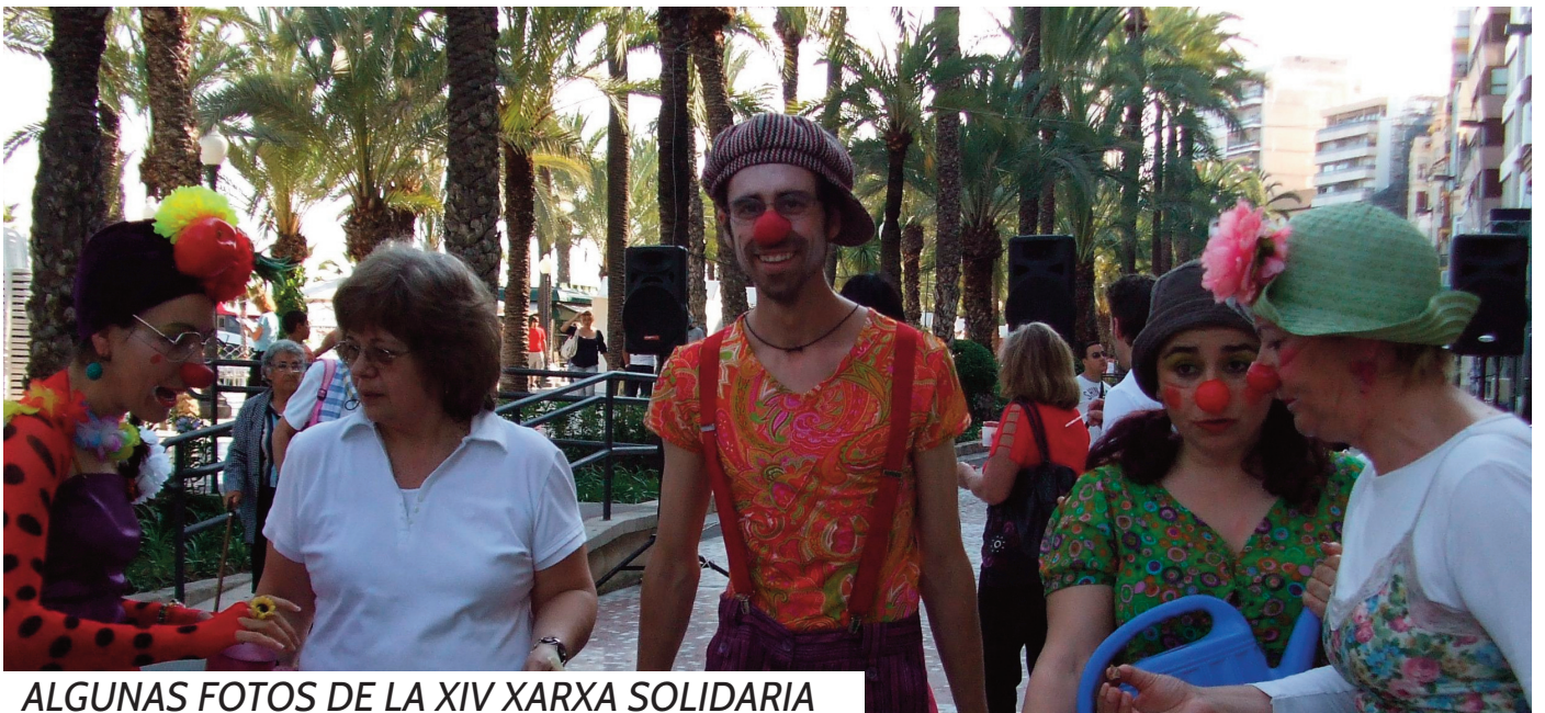
ALGUNAS FOTOS DE LA XIV XARXA SOLIDARIA